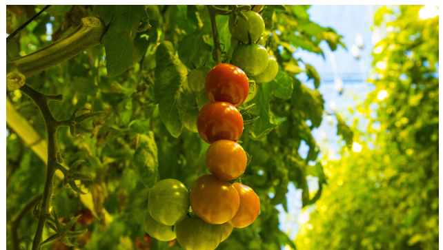
Intresset från butiker och kunder har varit stort och bolaget får mycket beröm för tomaternas smak.