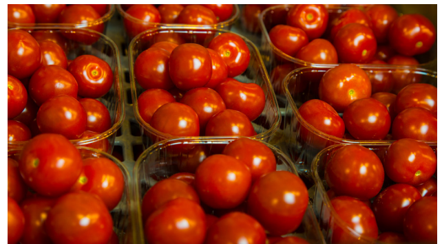
Bolaget säljer allt som växthuset producerar med dagliga leveranser till butiker och restauranger.