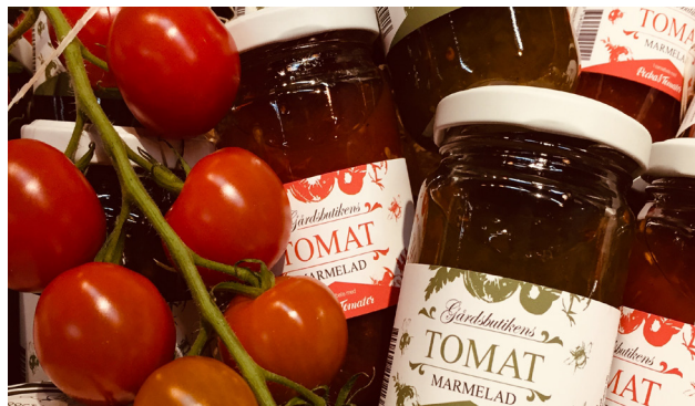
En grön och en röd tomatmarmelad har tagits fram.

Peckas Naturodlingar meddelar den 5 december 2018 att bolaget ingått ett samarbete med Gårdsbutiken i Nordingrå och tillsammans ta fram två nya premiumprodukter i form av en röd och en grön tomatmarmelad. Gårdsbutiken vann senast Silver i SM för Mathantverk och deras restaurang är rekommenderad i White Guide.