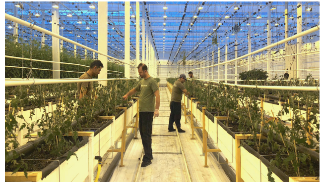
Här planteras de 1800 nya plantorna.

Peckas Naturodlingar meddelar den 10 oktober 2018 starten på nästa produktionscykel för att leverera lokala kretsloppsodlade produkter. Bolaget har planterat nya tomatplantor som utgör grunden för produktion av högkvalitativa och hållbara produkter under de kommande 12 månaderna.