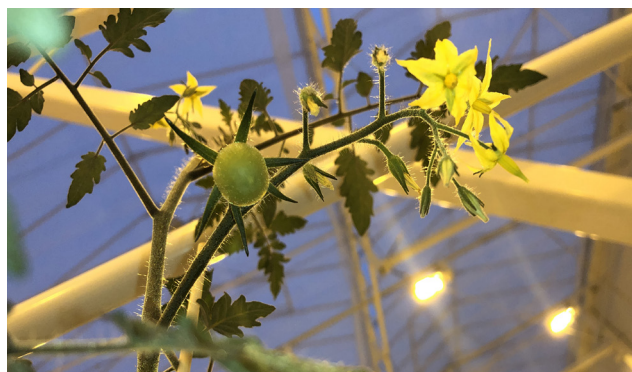
Tre sorters tomater planteras i det nya växthuset.

Den 20 december 2018 meddelar Peckas Naturodlingar att bolaget har färdigställt sin andra växthusanläggning i Härnösand. Anläggningen är på cirka 4 000 kvm och kompletterar det befintliga växthuset om 3 200 kvm vilket möjliggör en mer än fördubblad produktion av bolagets kretsloppsodlade tomater och fisk. Det nya växthuset i Härnösand är svaret på den ökande efterfrågan på hälsosam och hållbar mat.