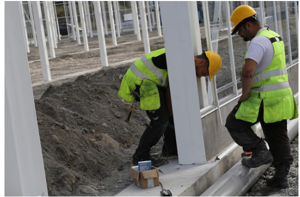
Montering av växthuset pågår.

Vårt mål är att växa i hela Sverige och producera på en total yta av 100 000 kvadratmeter vilket motsvarar en årlig produktion av 6 500 ton tomater och 650 ton fisk. Flera produktionsanläggningar är under projektering och nästa expansion sker i Sveriges storstadsregioner.