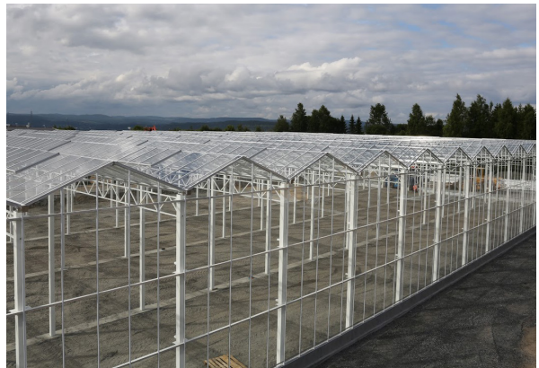
4000 kvm växthus för Europas största kretsloppsodling.